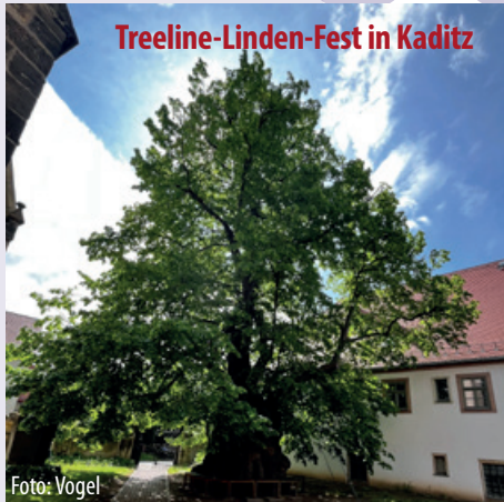
Treeline-Linden-Fest in Kaditz