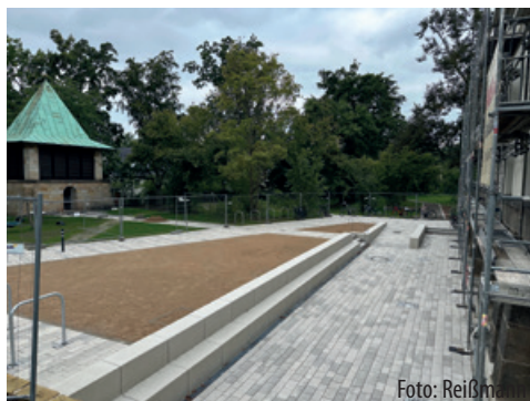
Vorplatz der Weinbergskirche im Oktober, noch ohne Pflanzungen

Wer in diesen Tagen die Weinbergskirche aufsucht, wird das Außengelände kaum mehr wiedererkennen. Nach fast einem Jahr – mit einigen Unterbrechungen – wurde das gesamte Außengelände neu gestaltet. Dank der Förderung des Sächsischen Umweltministeriums (Förderrichtlinie Stadtgrün, Lärm, Radon/2023 – Teil B), des Stadtbezirksbeirates Dresden-Pieschen sowie des Sächsischen Staatsministeriums für Wissenschaft, Kultur und Tourismus im Rahmen einer PMO-Einzelfallförderung konnten in den vergangenen Monaten neue Grünflächen mit standortgerechten Pflanzen, neue Bäume sowie neue Wege mit Sitzgelegenheiten im Freien errichtet werden. Damit ist ein neuer Anziehungspunkt für die Anwohner und Gemeindeglieder entstanden. Ein Besuch lohnt sich.